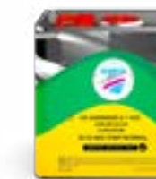
*LV 30-66/76/86 Slow/Norm/Fast