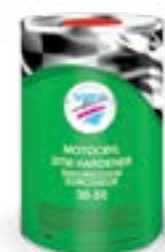
30-50 DTM Hardener

4 partes de Componente A con 1 parte de Endurecedor DTM 30-50 + 15-20% reductor 35-20